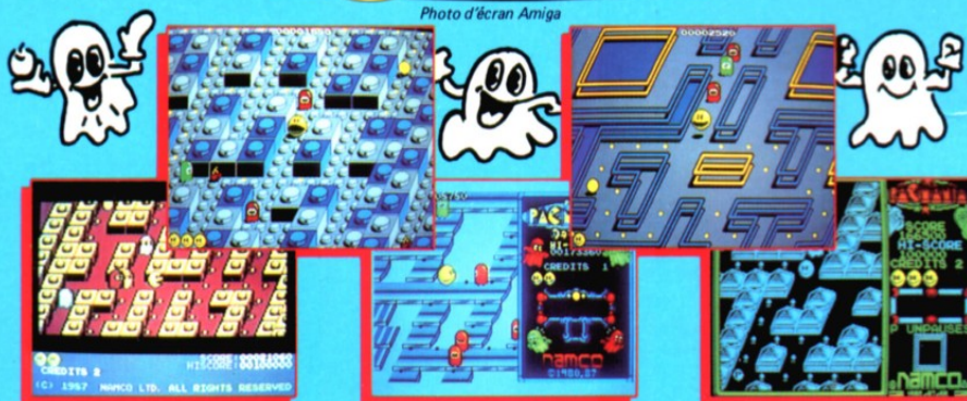
Photo d'écran C64