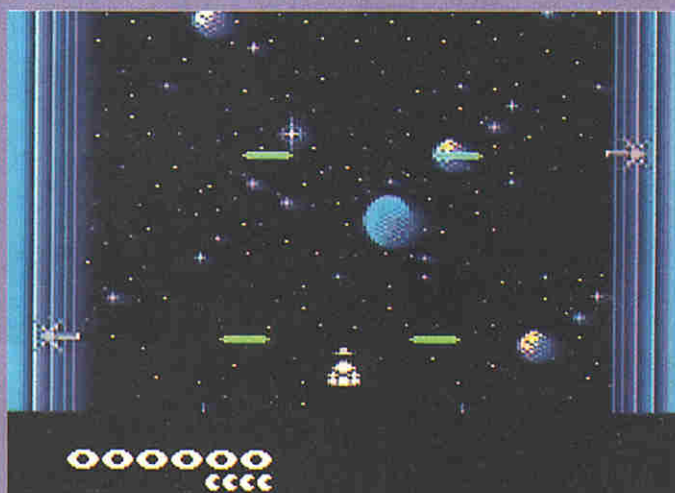
Den Raketenwerfern muß man geschickt ausweichen

LOAD "4*";8,1 den Lader des Spiels. Mit <RUN> startet man und gelangt in ein Menü, wo man mit den Funktionstasten zwischen einem Info-Programm, dem Spiel selbst und den Credits wählen kann. Wer ohne Intro und Ladescreen sofort spielen möchte, sollte es mit: LOAD "DONT*";8,1 versuchen. Nach dem Start mit <RUN>, wird das Game entpackt und es kann sofort auf Alienjagd gehen.