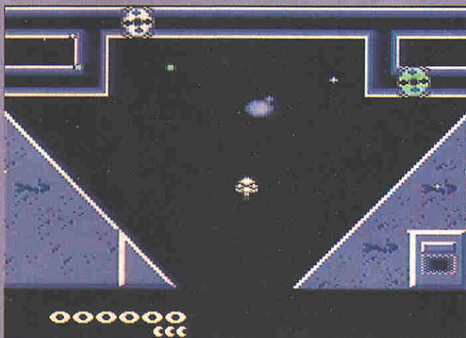
Fahrende Raketensilos versperren den Weg