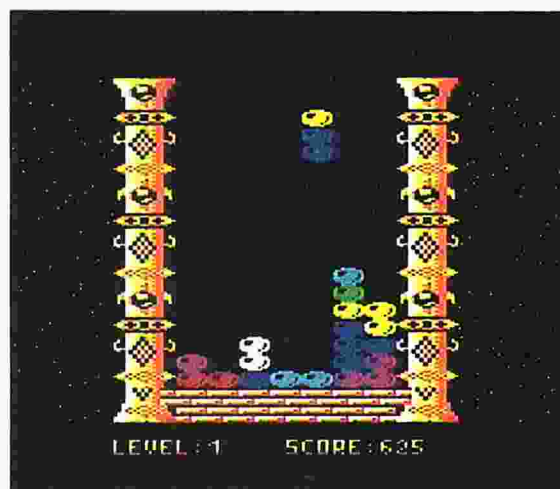
[1] In Level 1 ist noch genügend Platz für die Objekte

Programmart: Denkspiel Laden: LOAD "COLORS",8,1 Starten: nach dem Laden <RUN> eingeben Besonderheiten: High-Score wird nachgeladen Benötigte Blocks: 89 Programmautor: Matthias Deutsch