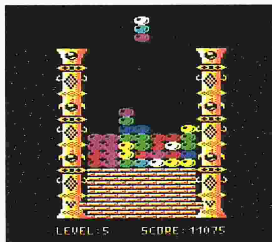
[3] In der fünften Spielstufe wird's schon ganz schön eng